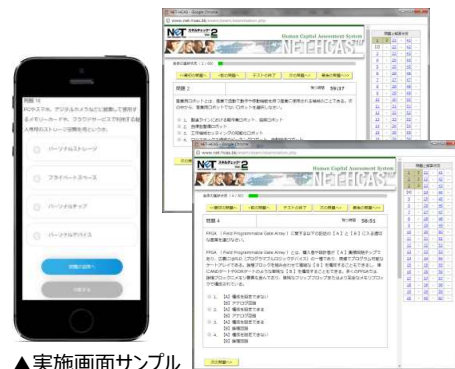
▲実施画面サンプル